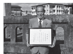
優良社会福祉協議会 表彰