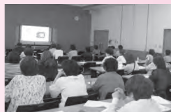
新任福祉推進員・ふれあい活動員研修会